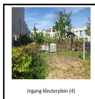
Ingang kleuterplein (4)

groep 6: 8.20 – 13.50 uur groep 3: 8.30 – 14.00 uur