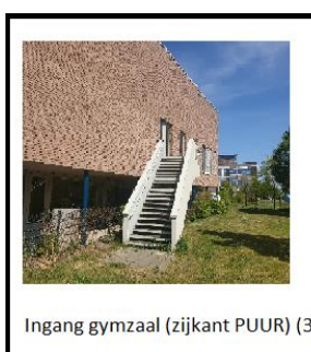
Ingang gymzaal (zijkant PUUR) (3)